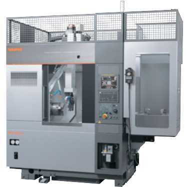
8インチ CNC精密旋盤 XT-8MY