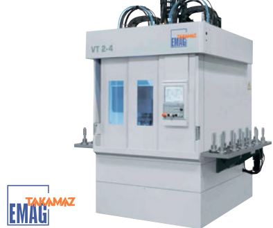
TAKAMAZ EMAG (ドイツ) 立形シャフト加工旋盤 VT 2-4