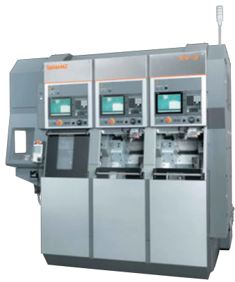
倒立形 CNC精密旋盤 XV-3